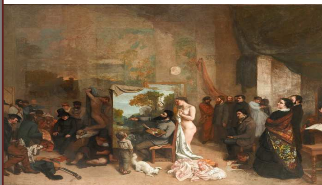
Gustave COURBET "L'atelier du peintre" 1855